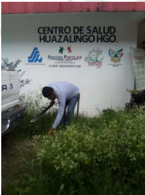
Chapoleo del centro de salud.