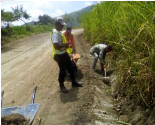
Mantenimiento de cunetas San Pedro Huazalingo.