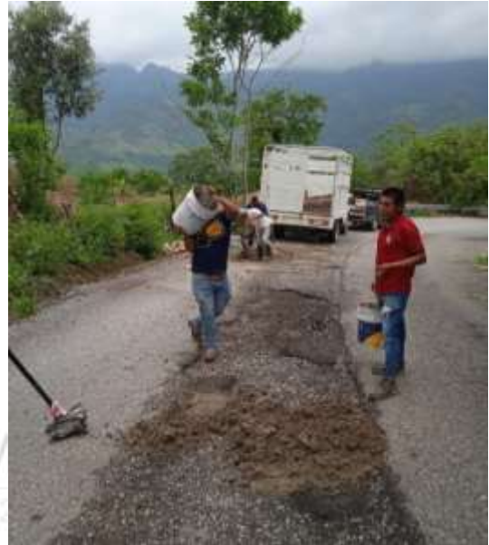
Relleno de bacheos en tramo Tochintlan - San Pedro.