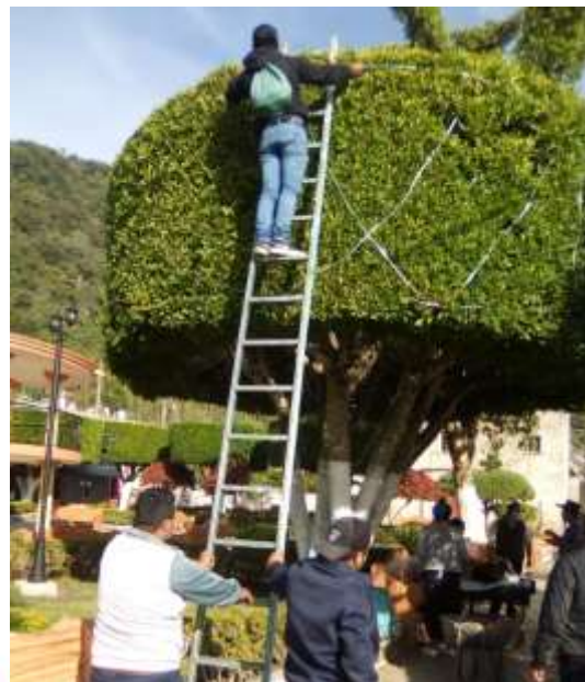
Poda de árboles en el jardín municipal.